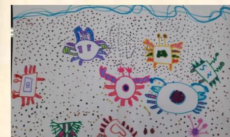
可愛的螃蟹 二甲 何蓉欣