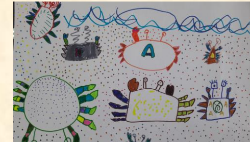
可愛的螃蟹 二甲 鍾佳妘