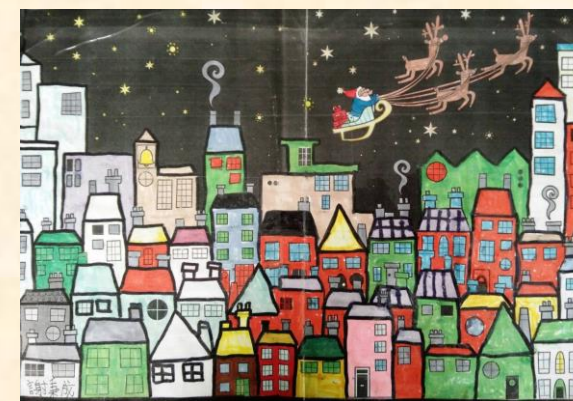
Christmas is Coming!! 三甲謝秉成