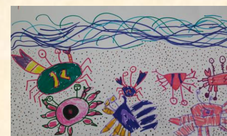
可愛的螃蟹 二甲 鍾侑恩